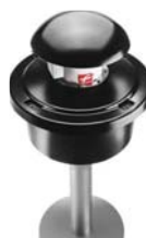
Filteri s više komora (prepumpne stanice, pivovare, mesnice...)