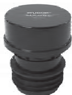
Maxi-Filtra DN 75-110