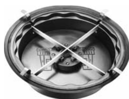
Aquastop zaštita od povrata vode